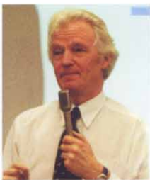
Oxford 大学医療科学研究所教授 英国国立電子健康図書館長