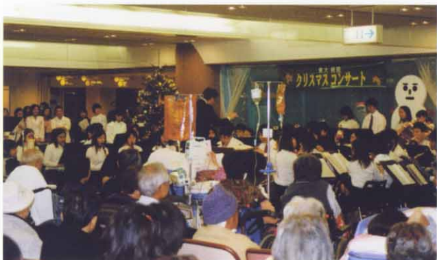
東大吹奏楽部のクリスマスコンサート