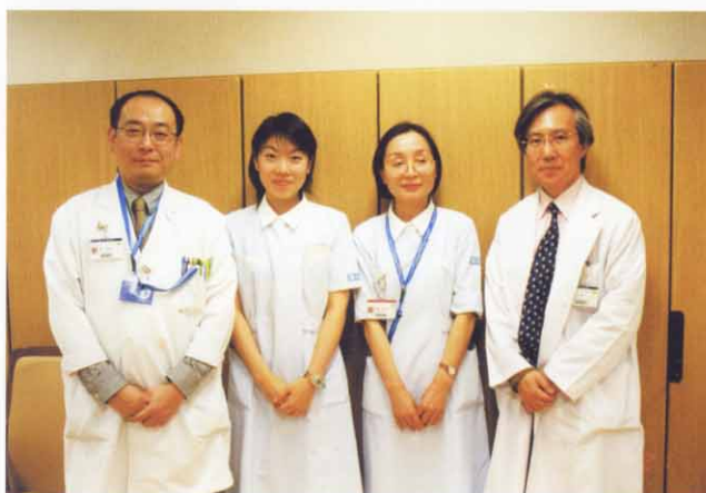
緩和ケア病棟スタッフ