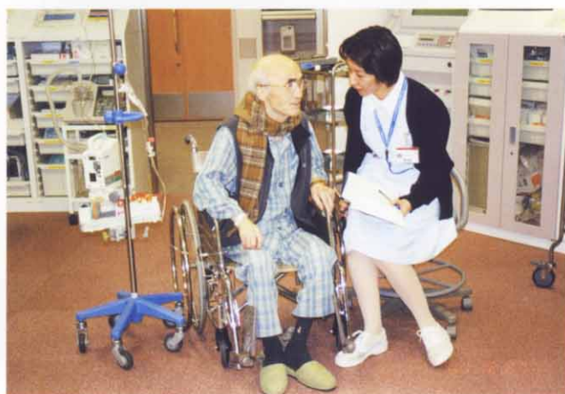
ある日の緩和ケア病棟