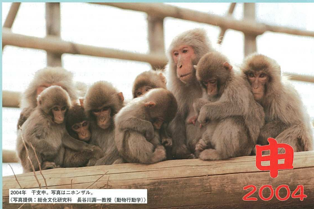
2004年 干支申。写真はニホンザル。 (写真提供：総合文化研究科 長谷川壽一教授 (動物行動学))