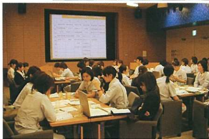
—看護職員の教育研修風景—

プログラムは必修研修・選択研修・専門研修の3つの枠組みで構成し、高度医療に見合う看護の提供について専門技術や倫理的側面も盛り込んでおります。他に感染対策や安全対策、褥瘡対策の勉強会が自主的に開かれております。