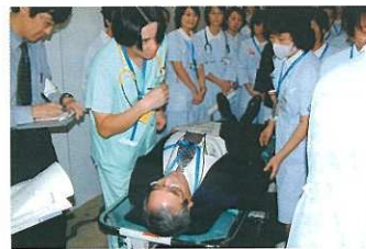
トリアージ訓練の様子