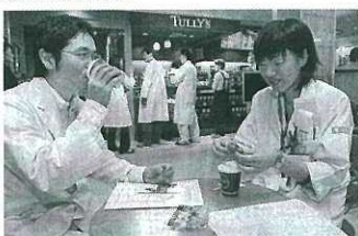
病院、役所にカフェ進出

「タリーズコーヒー好に会東大病院店」初の病院内店舗オープン 病院、役所にカフェ進出16.5.20 東京新聞(朝刊) 記事掲載。