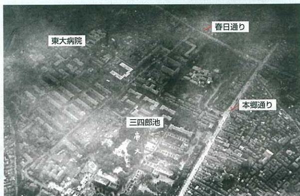
航空写真 関東大震災直後の火災の発生した東京帝国大学

幕末の安政江戸大地震（1855年・安政2年10月2日夜）があった。火災により約1万人が死亡した。