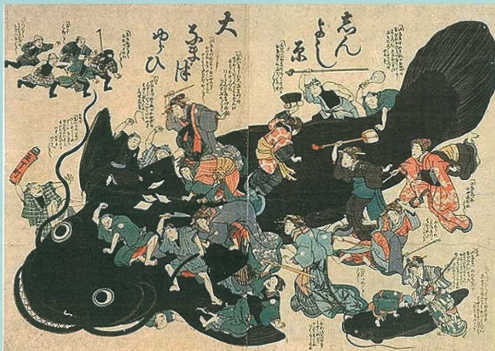
鯨絵「しんよし原大なますゆらひ」 安政の大地震以降、鯨絵が流行した。その中でこの鯨絵は最もよく知られている