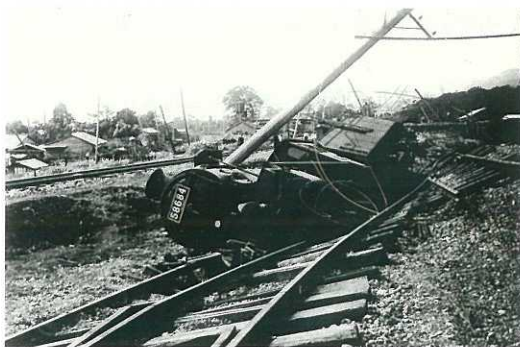
小田原駅構内被災写真

A. 新入院棟に第1防災センター、旧中央診療棟に第2防災センターがあり、第1防災センターに情報が集中するようになっています。