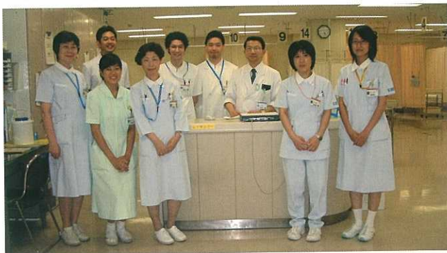
化学療法室スタッフ

月曜日と金曜日は大変混雑しています。可能でしたら、火曜日から木曜日をご利用ください。