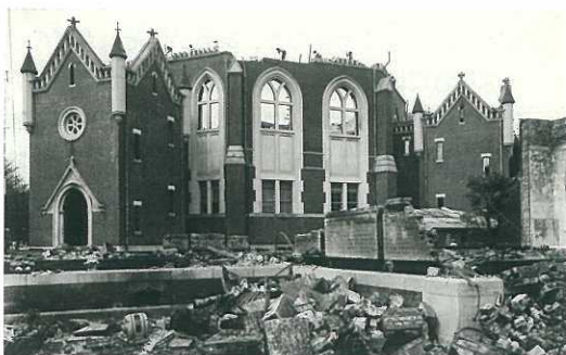
東京帝国大学法学部八角講堂被災写真

A. そうではありません。薬品棚や機器や本棚が倒れて火事が生じる可能性があります。地震では平屋が倒壊しやすくコンクリートの建物は丈夫ですが、一番怖いのは火事です。研究室には多数の薬品が無造作に並べられています。これが火事の原因になりやすいのです。研究室で設置される時に転倒防止策を施して頂けるとよいのですが。ところで9月に消防署による総点検が行われますが、独法化後は厳しくなる見込みで違反していると行政命令で使用できなくなる箇所も出るかもしれません。