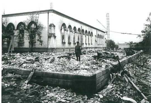
東京帝国大学法学部教室被災写真