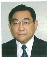
形成外科・美容外科