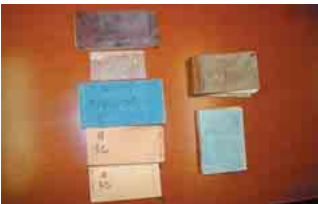
図1 7冊のノートと日記の表紙

佐々木曠は明治16年に卒業した後は岐阜に戻り病院で活躍した。明治41年には同級生の北里柴三郎が、来日した留学中の師であり結核菌を発見しノーベル医学生理学賞を受賞したドイツの Koch 博士とともに訪問している（図5）。