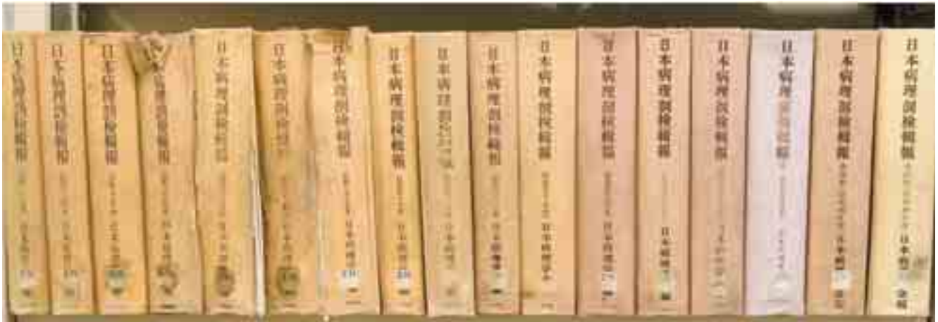
図2 病理解剖と日本病理剖検報 明治、大正期の病理解剖台（2号館壁面に嵌めこみ展示）、日本病理剖検報集

村 JCO 臨界事故における被爆者に対しても東大病院において治療が行われた。JCO 臨界事故による犠牲者については、病理解剖所見について詳細な検討結果を報告した (BJR Suppl 27:13-6, 2005)。