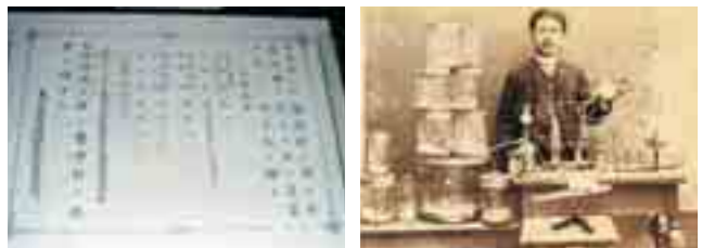
図3 北里柴三郎の東大医学部卒業証書 図4 ドイツ留学中の実験室にて

ドイツ留学から帰国したが研究するための受け皿がなく、福澤諭吉が援助の手を差し伸べて創られた私立伝染病研究所で研究を開始した。翌年の明治32年には