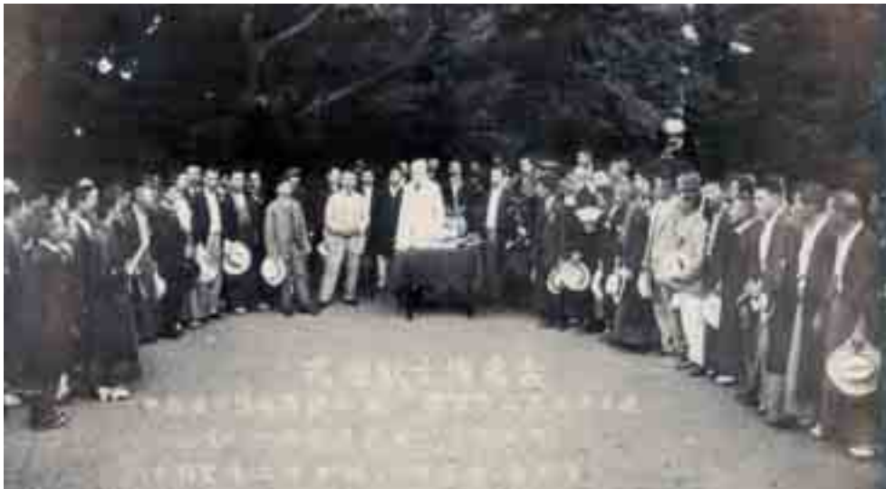
図5 明治41年、Koch 博士と北里柴三郎が岐阜の佐々木曠を訪れる。