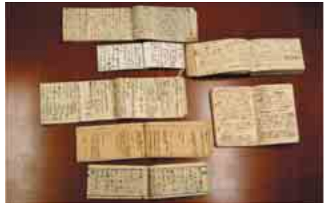
図2 7冊のノートと日記を見開きにしたところ

明治政府は戊辰戦争の際に、西郷隆盛が神戸の英国の領事館から招き“病院”として治療にあたらせ