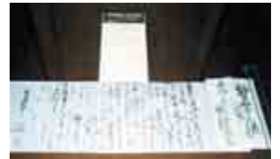
図6 福澤諭吉からの手紙

慶應大学にとり医学部の設立は長い間の懸案であった。初代の医学部長を打診された北里柴三郎は福澤諭吉の恩に報いるべく就任し、特に公衆衛生学に力を入れた(図6)。開校開院式の演説の末