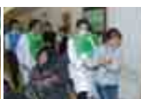
外来患者傷病者のトリアージ・搬送と患者様の避難誘導