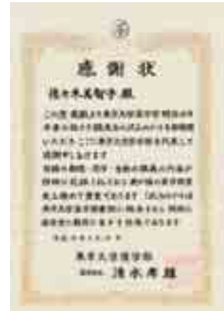
図3 川俣四也男のお孫さんの佐々木美智子様への 医学部長・清水孝雄教授からの感謝状