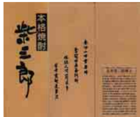
図7 北里柴三郎が生まれ育った阿蘇山のふもと町、小国町で売られている焼酎「柴三郎」