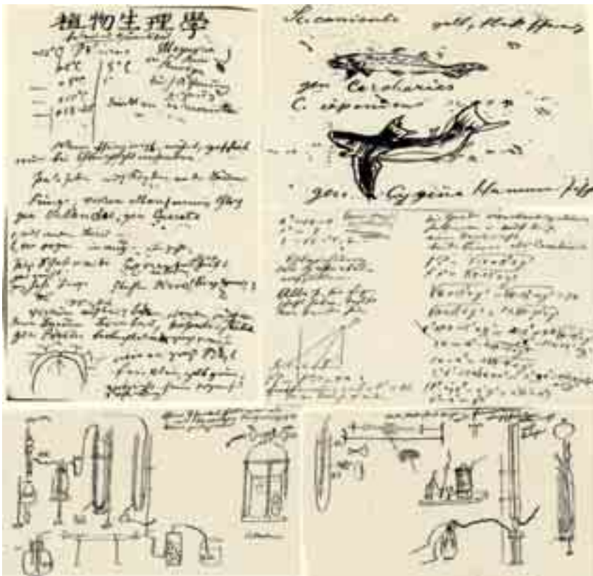
図4 ノートの植物学、動物学、数学、物理、化学