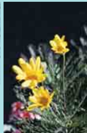
ユリオプスデージー

また、毎年春の到来を告げる外来棟前の「辛夷(こぶし)」が晩冬の青空を背景にして、白色の綿毛に包まれたつぼみの中に花びらを成長させる姿が見られ、春に備える草木の鮮やかな生命の息吹が感じられた。