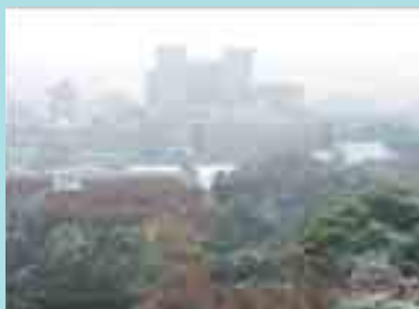
積雪 文学部3号館屋上

1月23日(水) 都心に平成18 年2月以来2年 ぶりの積雪があ り、文学部3号 館屋上からは、 雪の三四郎池と 東大病院の遠景 を望むことがで きた。