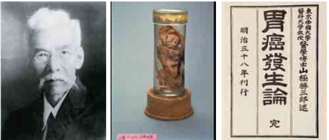
図1 山極勝三郎とがん研究 肖像（左）、ウサギの耳に作製されたタールがん（中央）、胃癌発生論（右）