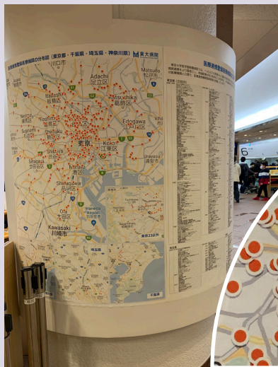
連携登録医療機関 地図

東大病院の連携登録医療機関の一覧及び地図を掲示し、詳細をご希望の患者さんは連携登録医療機関の情報を印刷することも可能です。今後も地域医療連携の強化に努めてまいりますので、よろしく願いいたします。