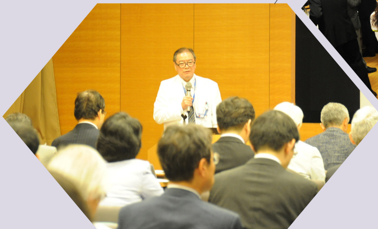
東大病院 地域医療連携会