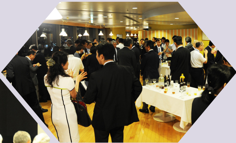
東大病院 地域医療連携懇親会