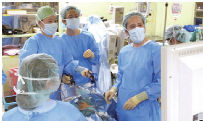
図1 内視鏡外科手術の様子

内視鏡外科手術とは、胸部や腹部に数か所小さな穴を開けて、専用の手術機器を挿入し、内視鏡による映像をテレビモニターでスタッフが共有しながら手術を行います(図1)。