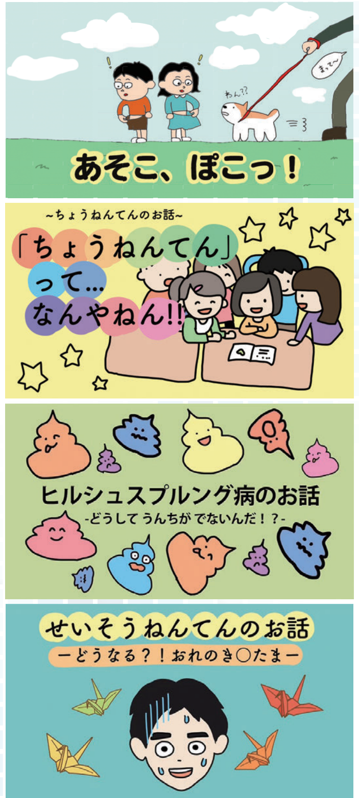
図3 作成した疾患紹介動画の一部