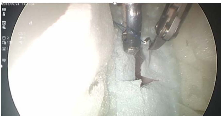
図2. 内視鏡下で硬膜モデルに針を刺す様子 (ロボット術具は直径3.5 mmで先端が屈曲する)