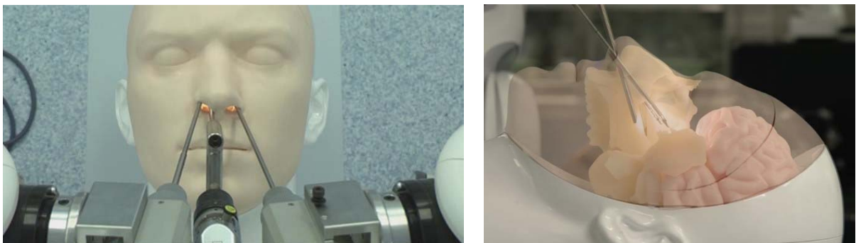
図1. 経鼻内視鏡手術を想定したスマートアームの操作 (バイオニックヒューマノイドを用いた評価と透視イメージ)